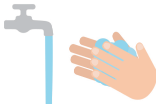
經常保持雙手清潔