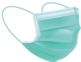
正確佩戴外科口罩